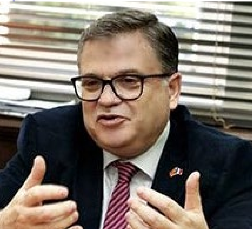
Kristijan Timonije Ambasador Francuske

Posljednji izvještaj Komisije o napretku i zaključci Međuvladine konferencije koja je upravo održana 13. decembra dovoljno su jasni. Ohrabrujemo Crnu Goru da se vrati na put reformi, posebno u pogledu konsolidacije