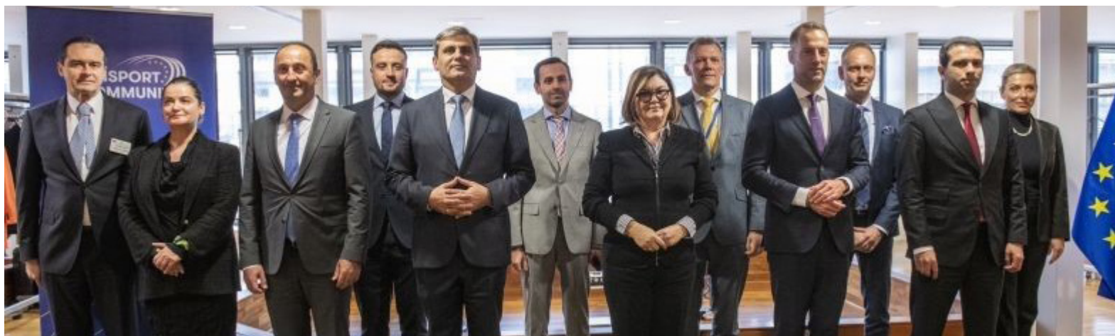
Sa sastana Transportne zajednice kojom predsjedava Crna Gora

Balkana odvijaju se u posebnom okviru poznatom kao proces stabilizacije i pridruživanja.