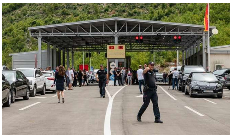
Foto: ZGP između CG i R. Albanije Zatrijebacka cijevna Grabon

Uz finansijsku podršku EU i tadašnjeg Ministarstva javne uprave, digitalnog duštva i medija, NVO „Pravni centar“ realizovala je, u partnerstvu sa organizacijom „Caritas“, projekat „Moj advokat-besplatna i profesionalna pravna pomoć u efikasnom pristupu pravima za migrante“, u periodu od 15. januara 2020. do 15. jula 2021. godine. Iz Pravnog centra, saopštili su, da je u okviru projekta 677 lica dobilo besplatnu pravnu podršku, 34 lica dobila su finansijsku podršku u plaćanju administrativnih taksi, dok je 38 stranaca zastupano u postupku odobravanja međunarodne zaštite pred upravnim organima i sudom. U toj NVO kazali su i da je, pored ostalog, obavljeno i 146 terenskih posjeta, te podijeljeno 350 paketa humanitarne pomoći ugroženim ciljnim grupama u 13 crnogorskih opština.