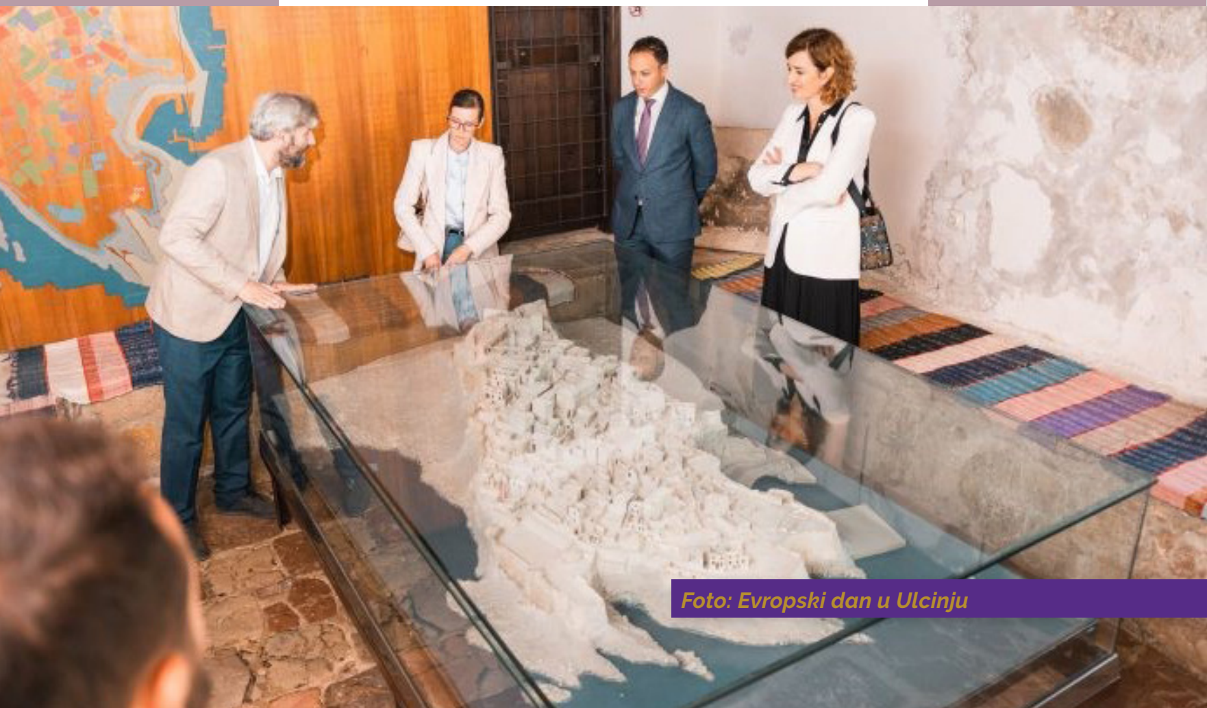
Foto: Evropski dan u Ulcinju