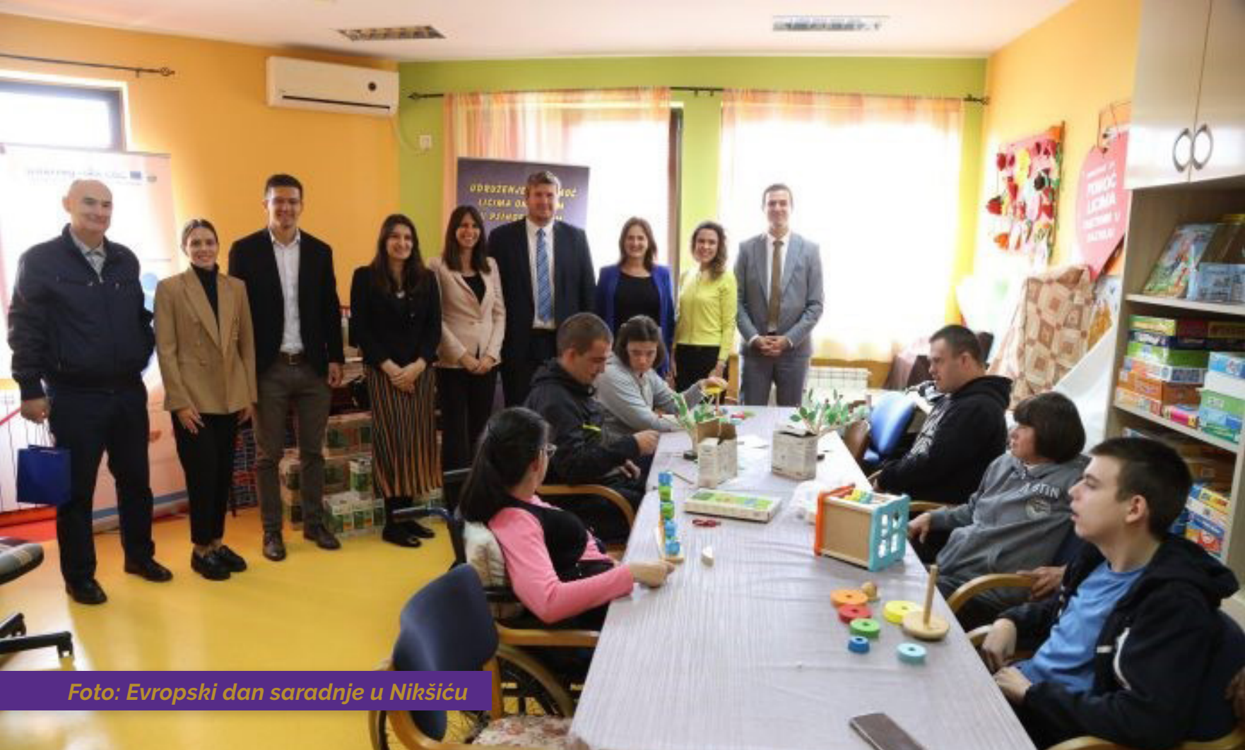
Foto: Evropski dan saradnje u Nikšiću