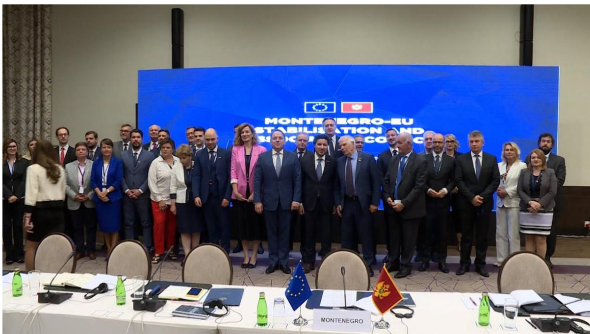
Posjeta predsjednika Evropskog savjeta Crnoj Gori: